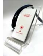
本体 ホワイト/ブラック(1)