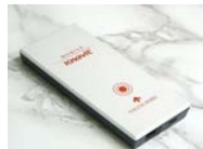
本体 ホワイト/ブラック(2)