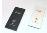
本体 ホワイト/ブラック、ブラック

株式会社モバート 担当：福島 TEL：042-313-7547 URL： http://www.camel7.jp/